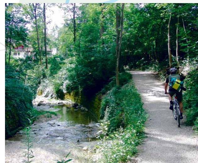
6 ... Biker-Trail mit natürlichem Airconditioning