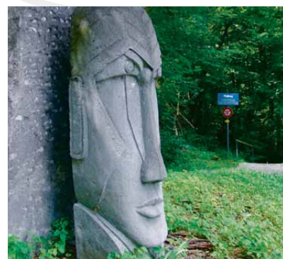
Die Osterinsel lassen grüssen