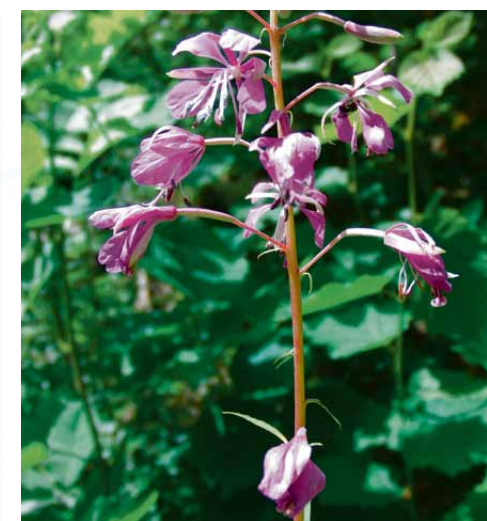
Biokunde am Wegrand