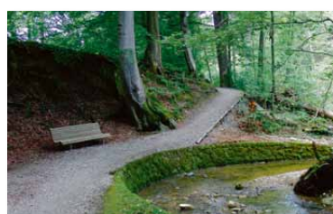
2 Sanfter Einstieg ins Wehrenbachtobel