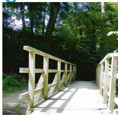
3 Übergang in die «Kühlzone»