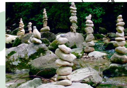
Körperbalance mit Steinen