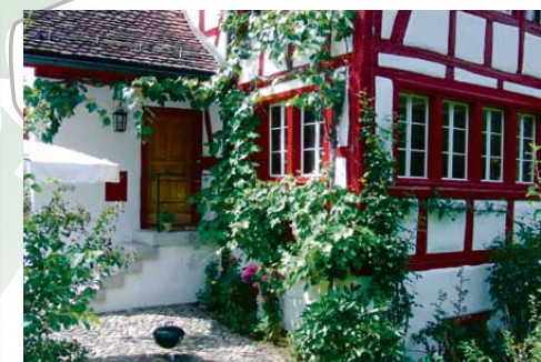
7 Landidylle «mitten» in der Stadt