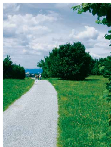
1 Die weite Landschaft zum Auftakt